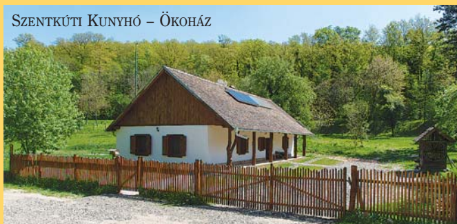
SZENTKÚTI KUNYHÓ – ÖKOHÁZ

megfelelő előadásmódban, szakvezetéssel zajlanak. Az erdei iskola programjait az Országos Erdészeti Egyesület Erdészeti Erdei Iskola Szakosztálya és a Környezet és Természetvédelmi Oktatóközpontok Országos Szövetsége minősítette.