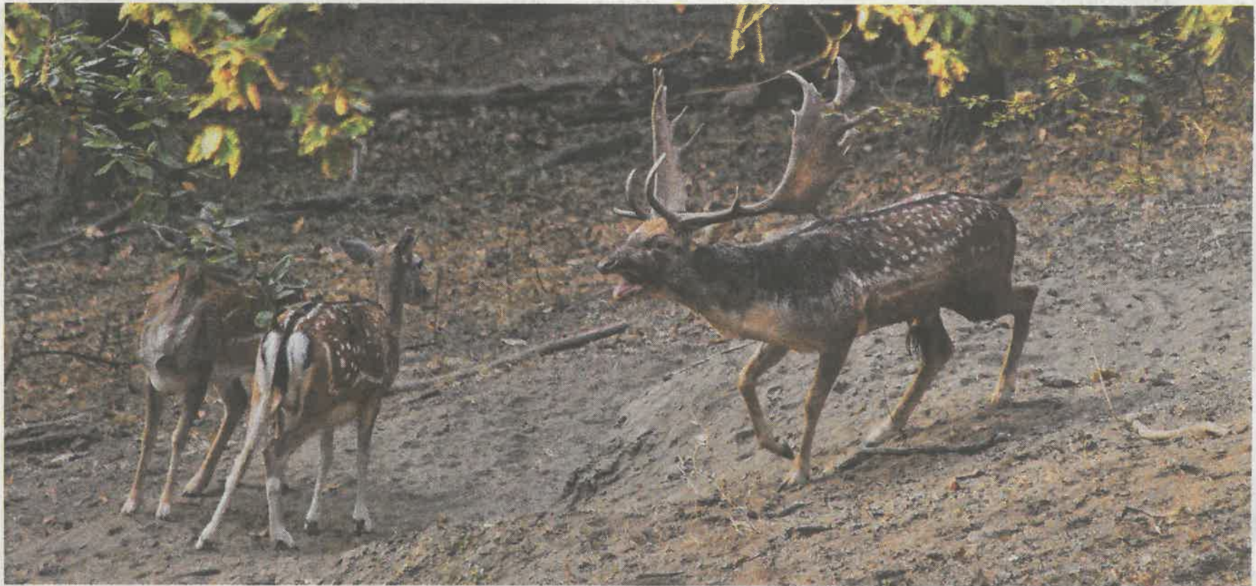
A dám bikák gyakorlatilag szünet nélkül rezegtetik kifejezetten erős hangszálaikat, emellett megküzdnek egymással a hölgyek kegyeiért

Az ügyészség 2017. július 4-én mindhárom gyanúsított esetében egy évre elhalasztotta a vádemelést, és arra kötelezte őket, hogy 6 hónapig tartó, folyamatos, kábítószer-függőséget gyógyító kezelésen, kábítószer-használatot kezelő más ellátáson, vagy megelőző-felvilágosító szolgáltatáson vegyenek részt. A vádlottak ezt az előírt határidőre nem teljesítették, ezért a törvény rendelkezésénél fogva vádat kellett emelni ellenük. A vádlottak közül ketten büntetlen előéletűek, a 26 éves férfit más jellegű bűncselekmény miatt korábban közérdekű munkára ítélte a bíróság. Az ügyészség mindhárom vádlott esetében tárgyalás mellőzésével pénzbüntetés kiszabását és a lefoglalt bűnjelek elkobzását szorgalmazza a Szekszárdi Járásbíróságnál, tájékoztatott dr. Kiss Yvette, a Tolna Megyei Főügyészség sajtószóvivője. I. I.