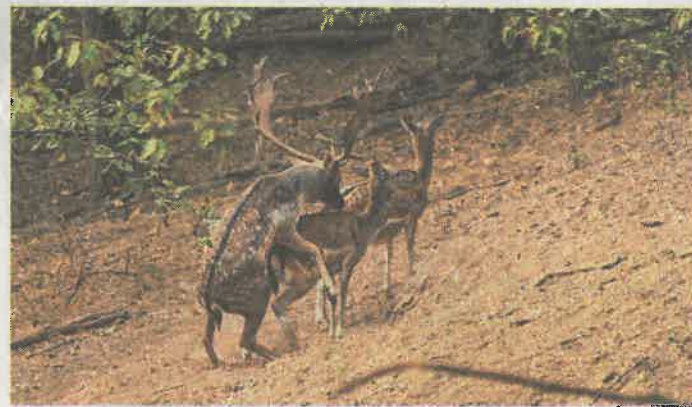
A győztes elnyeri méltó jutalmát...

A győzelemre, azaz a teheneik kegyeinek elnyerésére elvileg úgy kétezer bikának lehet esélye, mivel ennyi hím ivarú egyed – és nagyjából ugyanennyi nőstény – kószál a gyulai erdészet területén. Képzelnék el, amint október elejétől október végéig, azaz a párzási időszakban ez a kétezeres kórus gyakorlatilag szünet nélkül rezegteti kifejezetten erős hangszálaikat. Emellett megküzd egymással, ha kell, életre-halálra. A dámokban ugyanis sokkal nagyobb az agresszivitás, mint a gimekben.